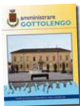
In copertina: Facciata e piazza del Comune

Fotocomposizione e stampa COM&PRINT S.r.l. - Brescia